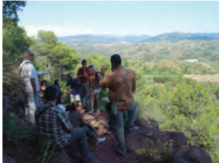
FIG.1. El 'enosenderismo' ya es una realidad en diferentes territorios vitivinícolas. Ruta enosenderista en la comarca catalana de El Priorat

Los itinerarios interpretativos de carácter temático, tanto guiados como autoguiados y mixtos, constituyen así un producto original que ya forma parte de la oferta de ocio de muchos territorios, siendo muy bien valorados por las personas que los disfrutan, en la medida en que se ofrece una actividad planificada, atractiva y de calidad, que permite descubrir aspectos difícilmente alcanzables mediante otro tipo de planteamientos más convencionales. A través de estos recorridos se logra sorprender a los participantes por la introducción de elementos inesperados en las rutas, promover experiencias vitales - individuales, grupales y colectivas-, generar sensaciones y suscitar emociones, y al mismo tiempo, trabajar ámbitos como la educación y la sensibilización para fomentar actitudes dinámicas y comprometidas con respecto al patrimonio.