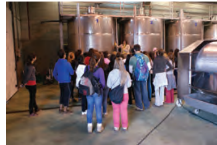
FIG.4. Tegueste cuenta con infraestructura y recursos humanos adecuados para el desarrollo de la práctica enosenderista. Bodega El Lomo

pone un factor positivo para organizar distintos tipos de actividades. Concluyendo así que existe infraestructura y trayectoria que puede garantizar el éxito de una propuesta de enosenderismo en el municipio de Tegueste, sobre todo si se corrigen determinados problemas identificados y se adecúan ciertos recursos y espacios.