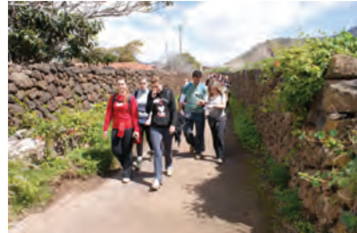
FIG.2. Tegueste aún dispone de caminos tradicionales adecuados para la práctica senderista vinculada con el vino y su cultura. Recorrido a pie entre Bodega Finca La Isleta y El Molino a través del camino de San Luis

ción de origen en el municipio de Tegueste. Se valoró además la posibilidad de llevar a cabo una labor estrechamente vinculada con los protagonistas del sector vitivinícola teguestero, que participaron de forma activa en el conjunto de actividades programadas, siendo ésta una experiencia enriquecedora y gratificante para las personas participantes en el proceso de trabajo. Cabe señalar que los fines docentes o académicos se alcanzaron con suficiencia, desarrollándose las distintas etapas previstas en el planteamiento metodológico, que se definió de manera conjunta con el alumnado al inicio del curso académico 5 .