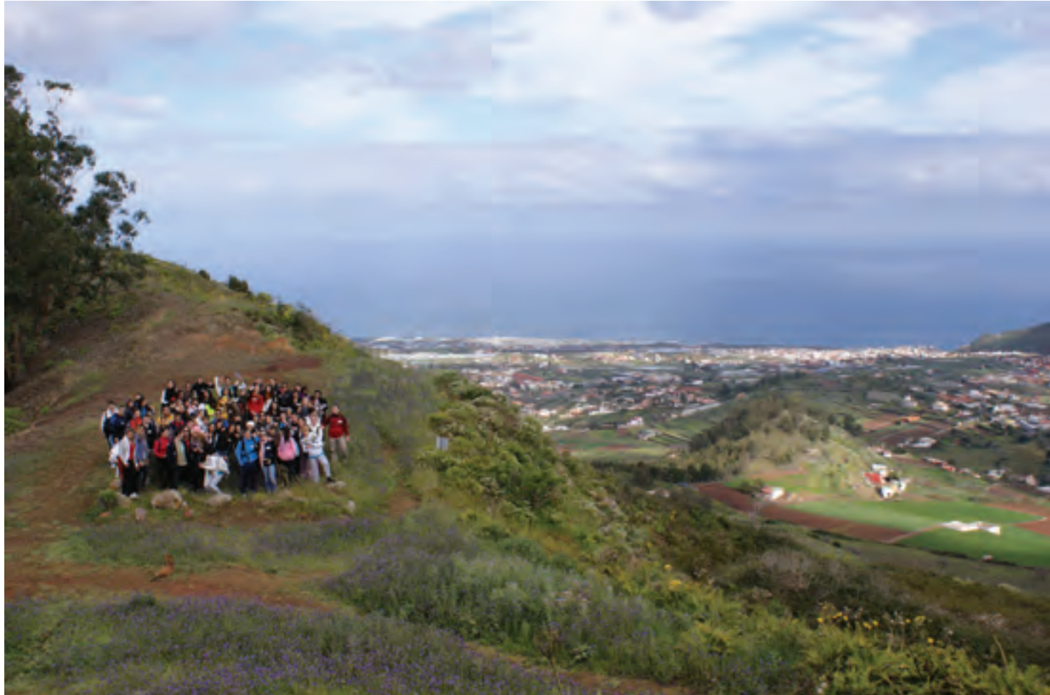
FIG.6. La Universidad puede realizar una interesante aportación al desarrollo enoturístico de la isla. Estudiantes participantes en el proyecto 'Caminando entre viñedos' en el entorno de El Portezuelo