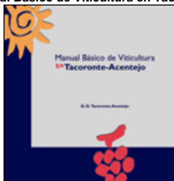
Figura 3. Manual Básico de Viticultura en Tacoronte-Acentejo